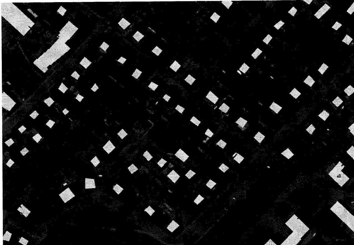
Paveikslėlis Nr. 1

*Pastaba: Pateikti šilumos tinklų ruožų ilgiai, ruožų konfigūracija gali keistis atsižvelgiant į numatomų statybos plotų atnaujintas inžinerinių komunikacijų topografines nuotraukas bei priimtus techninius sprendimus.